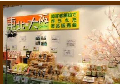
感花コラボ企画 『NPO法人 トウギャザー』さん in 食博

四年に一度の食の祭典「食博」が4月26日～5月6日までインテックス大阪で開催されていたのをご存じですか？11日間で65万人以上が参加したという結構大きなイベント。